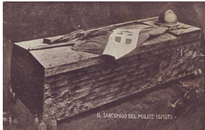
Foto del sarcofago originale del milite ignoto

“Quèstu, sapisse, me fa, jè u munumènde a i suldate cadute nd'a la prima wèrra mundiale du quinnece/decedotte e dinde ce sta sulamènde nu taute che nu cresejane scanscjute ca nne jè nu scenziante, nu gèneje, nu pèzze rösse o nu dotte