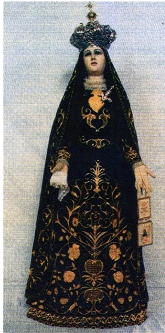
e la Madonna con il coltello nel cuore.