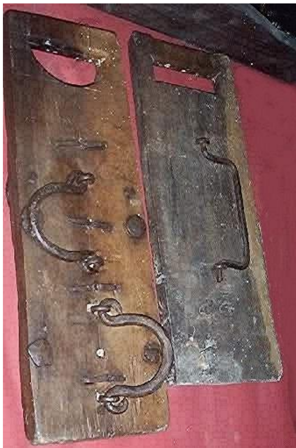
Due tipi di "dróccela" che sostituiva il suono delle campane dal giovedì Santo fino allo scioglimento delle campane al canto del Gloria il sabato Santo. Durante questo lasso di tempo era questo strumento a chiamare i fedeli alle cerimonie in quel periodo di lutto e silenzio liturgico.